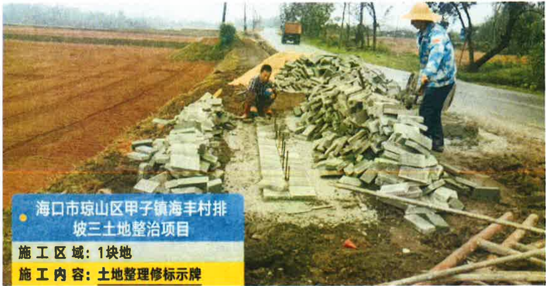
项目标志牌施工中