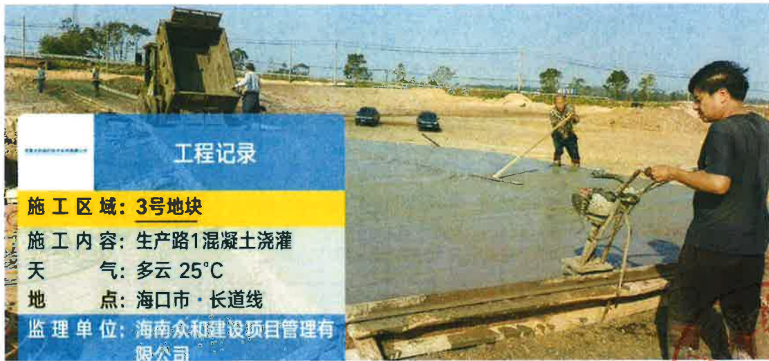
生产路1 施工中（路面浇筑）