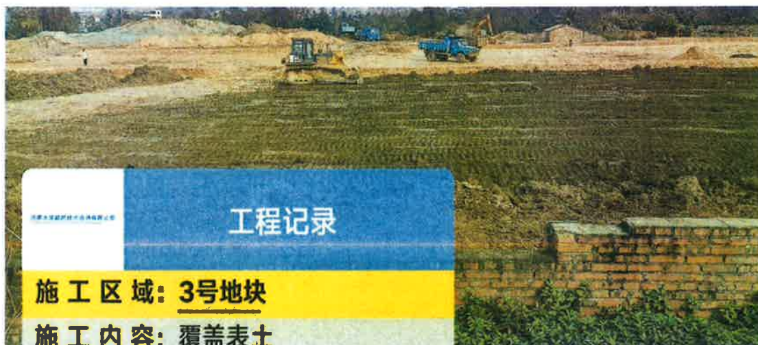
3号地块施工中(客土回填)