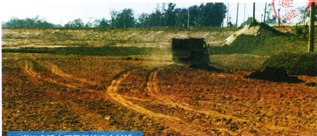
2号地块施工中（土壤改良）