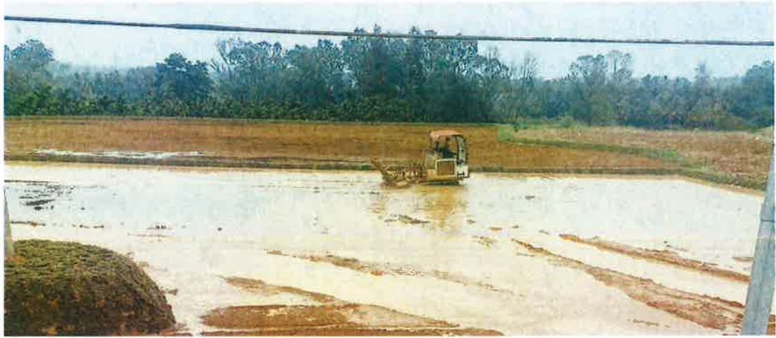
2号地块施工中（干旋）