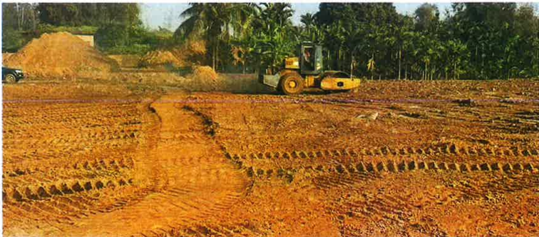
1号地块施工中（犁底层碾压）