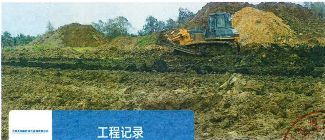
3号地块施工中（土地平整）