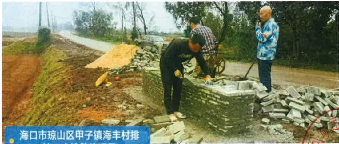
项目标志牌施工中