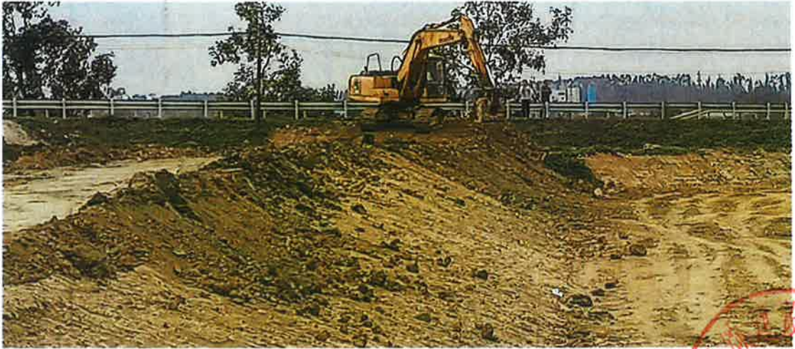
生产路1 施工中（路基修整）