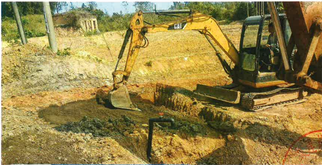
下田坡道施工中（铺设级配碎石）