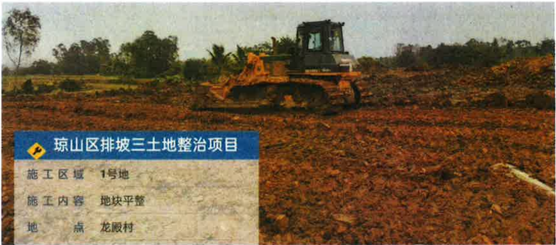
1号地块施工中（土地平整）