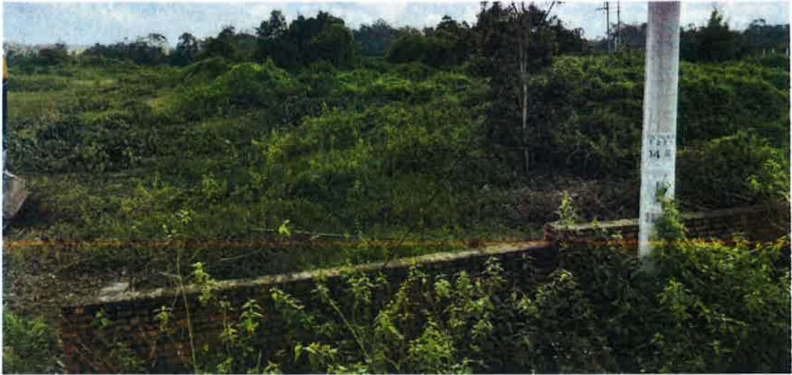
1号地块施工前（灌木林地）