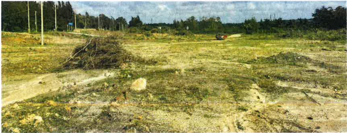
2号地块施工前（草地）