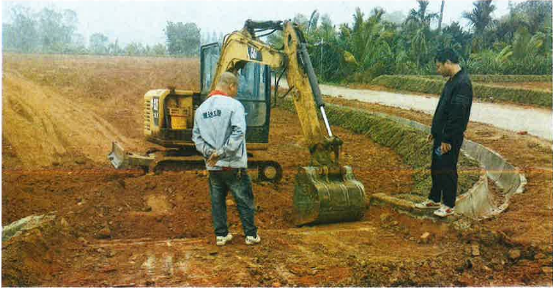
下田坡道施工中（基面平整）