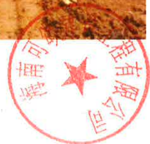
1号地块施工中（土壤改良）

海口市琼山区甲子镇海丰村排 坡三土地整治项目 施工区域: 1块地 施工内容: 撒肥料