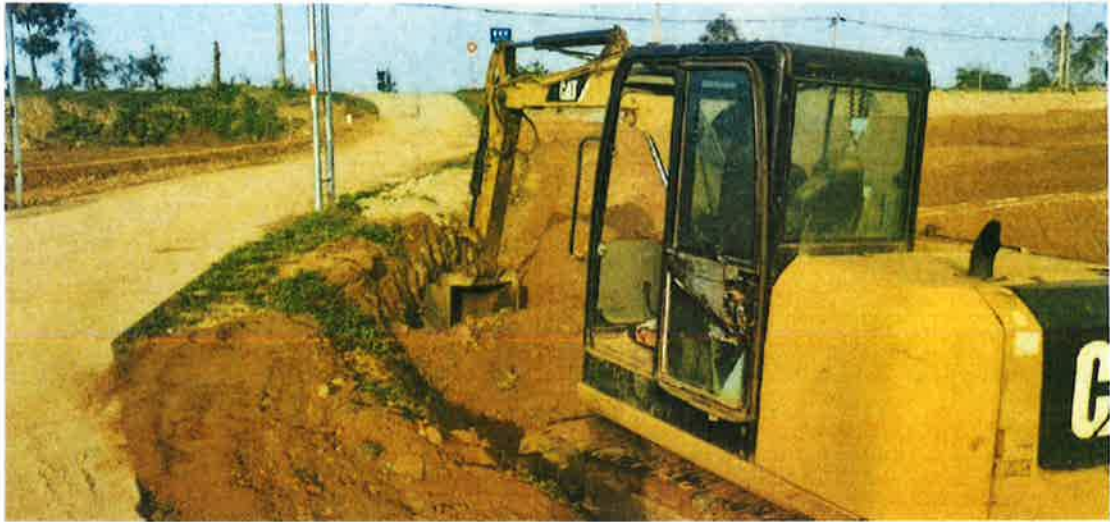
农沟施工中（沟槽形状开挖）