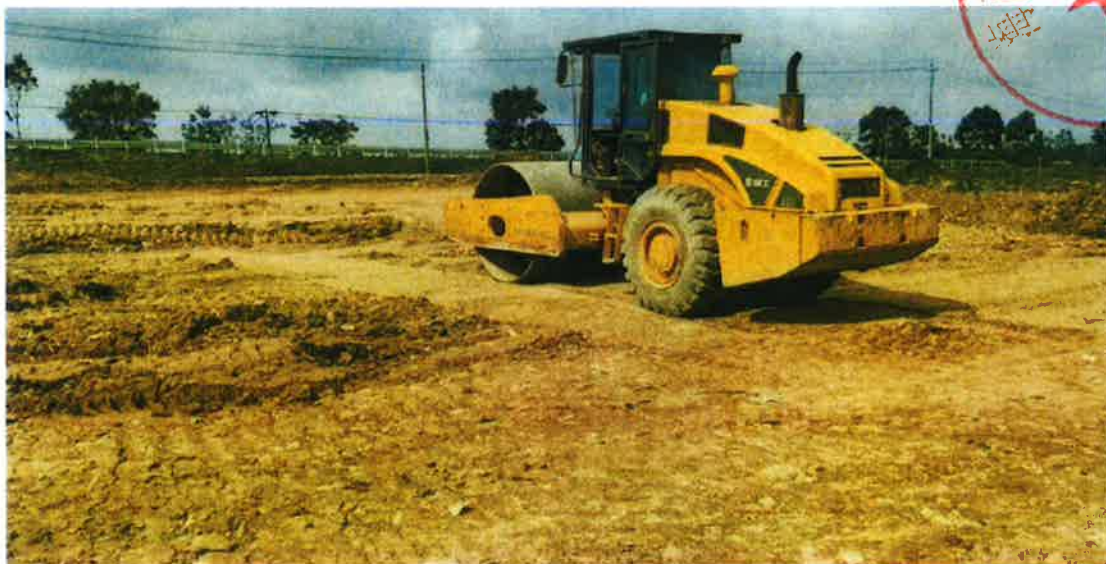
3号地块施工中（犁底层碾压）