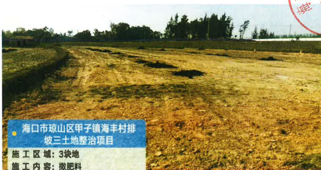
3号地块施工中(土壤改良)