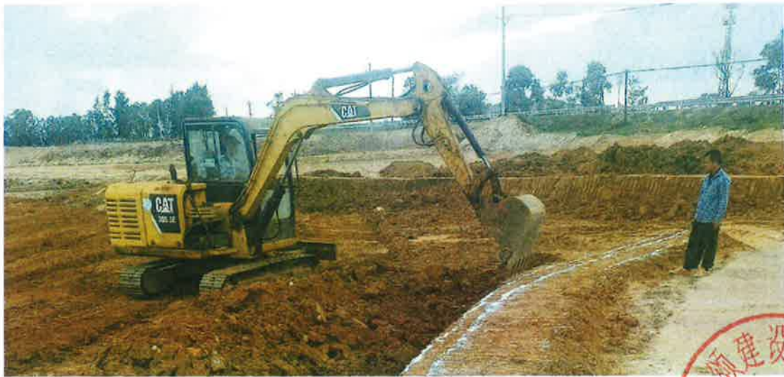
2号地块施工中（田埂修筑）