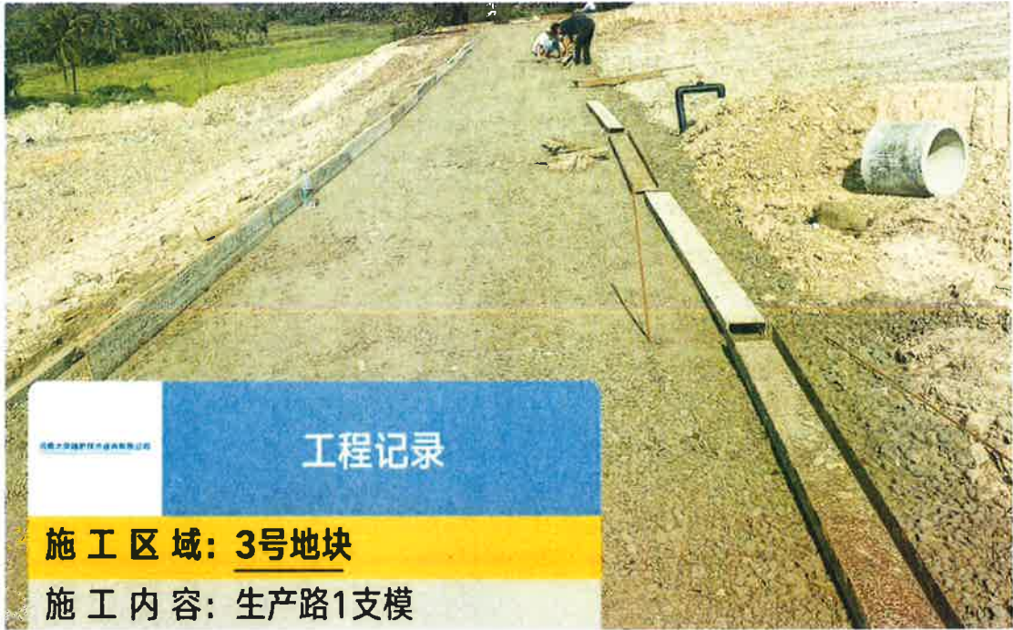
生产路1 施工中（支模）