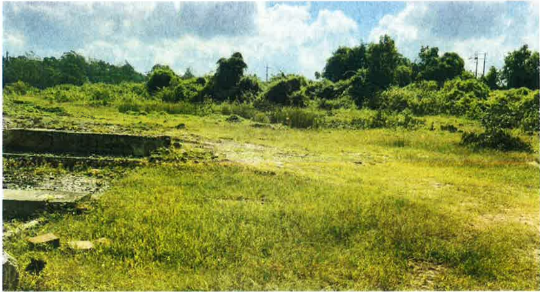
3号地块施工前（草地）