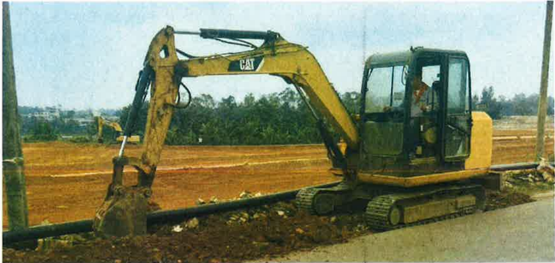
灌溉管道施工中（管槽开挖）