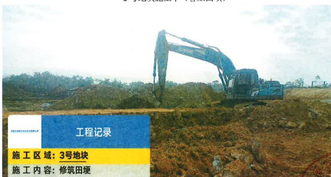
3号地块施工中(田埂修筑)