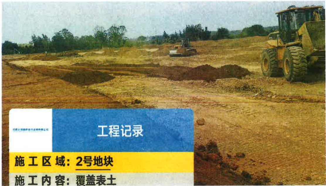
2号地块施工中（客土回填）