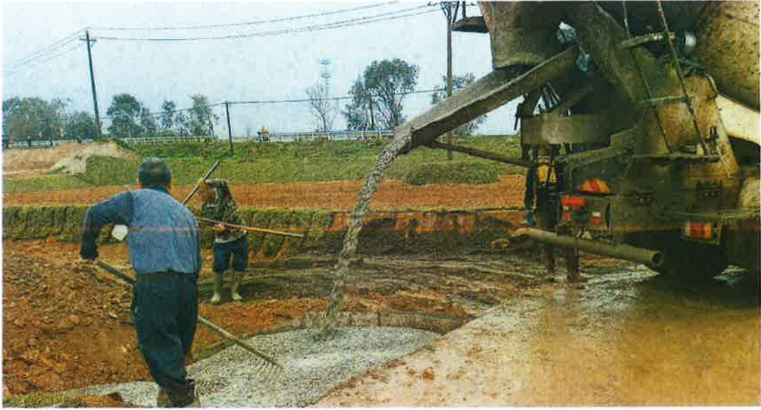
下田坡道施工中（混凝土浇筑）