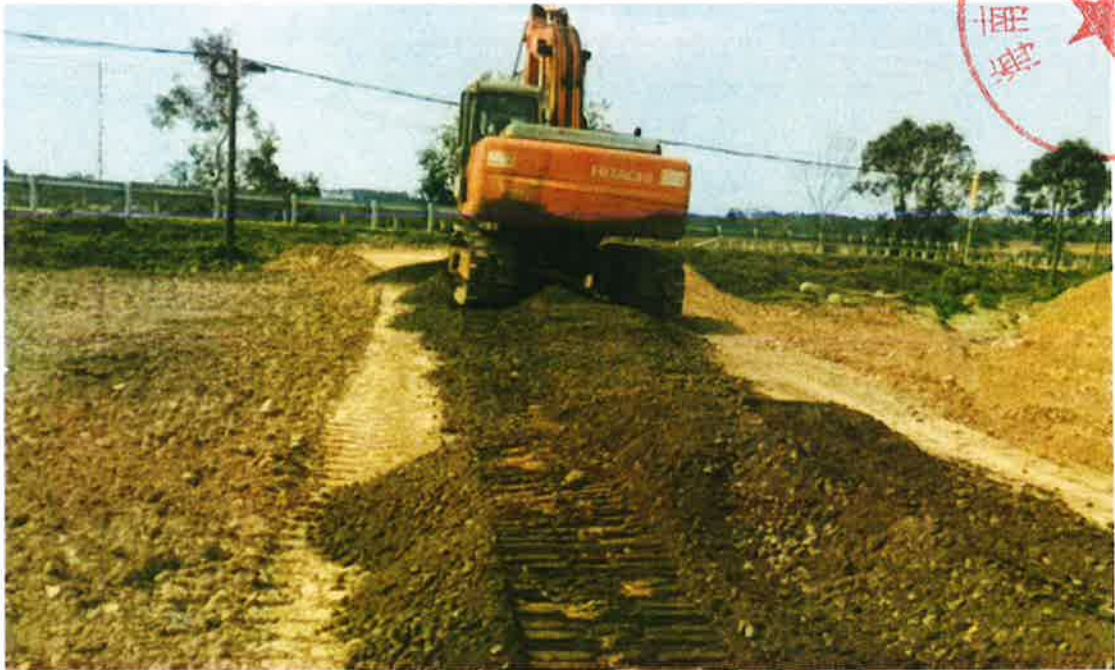
生产路1 施工中（级配碎石垫层）