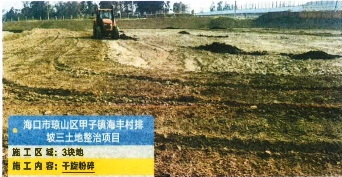
3号地块施工中(干旋)