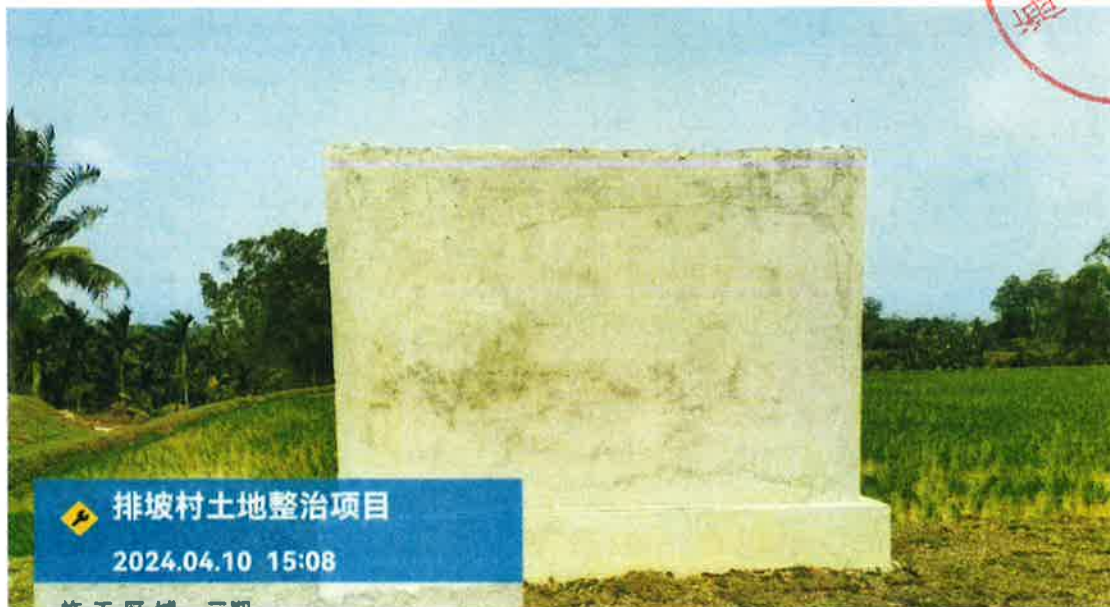
项目标志牌施工后