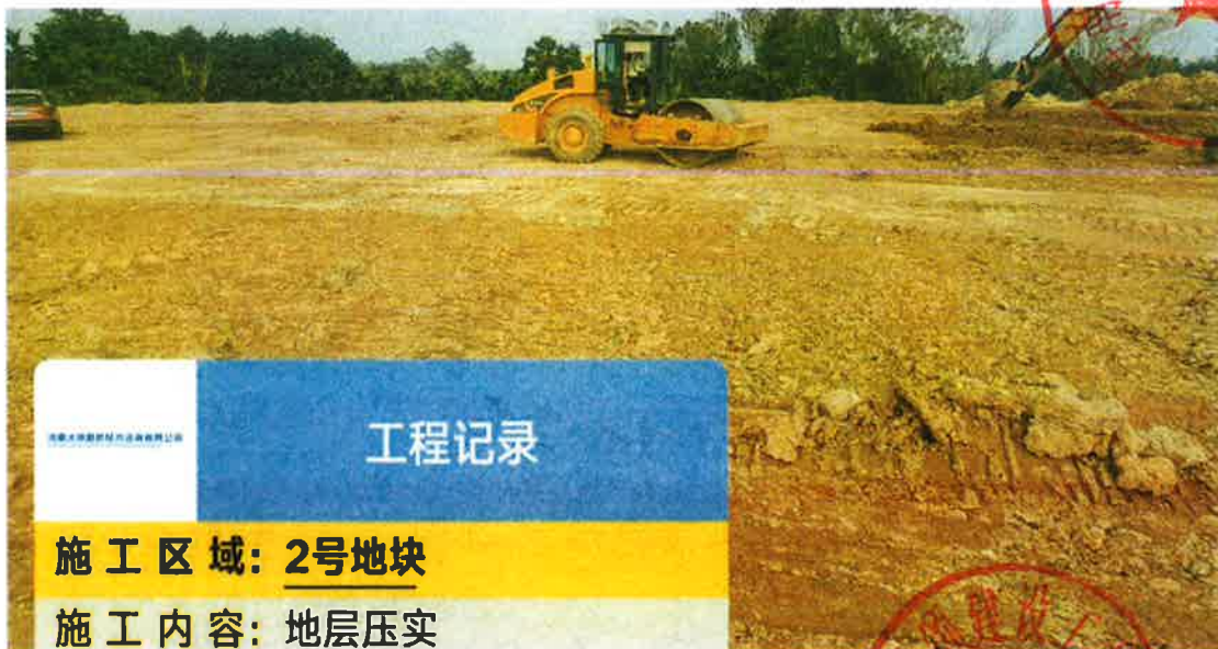
2号地块施工中（土地平整）