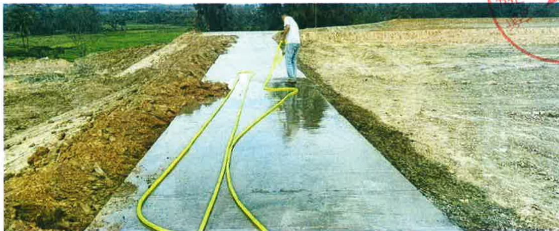
生产路1 施工后（路面养护）