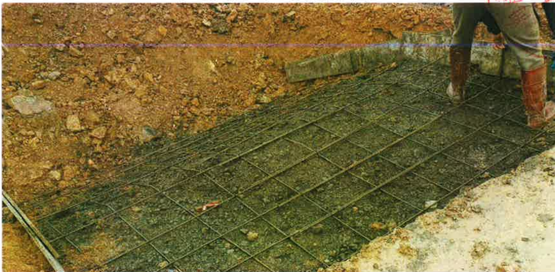
下田坡道施工中（绑扎钢筋）