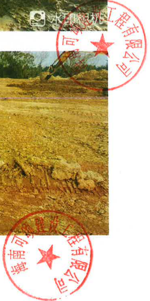
2号地块施工中（犁底层碾压）