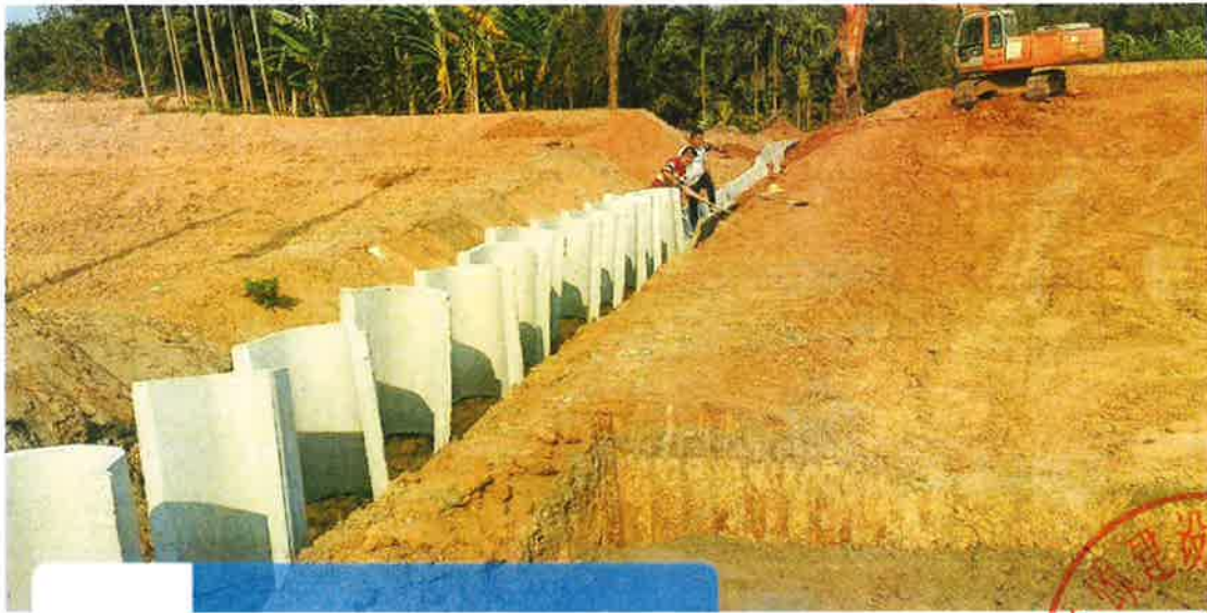
农沟施工中（U形槽安装）