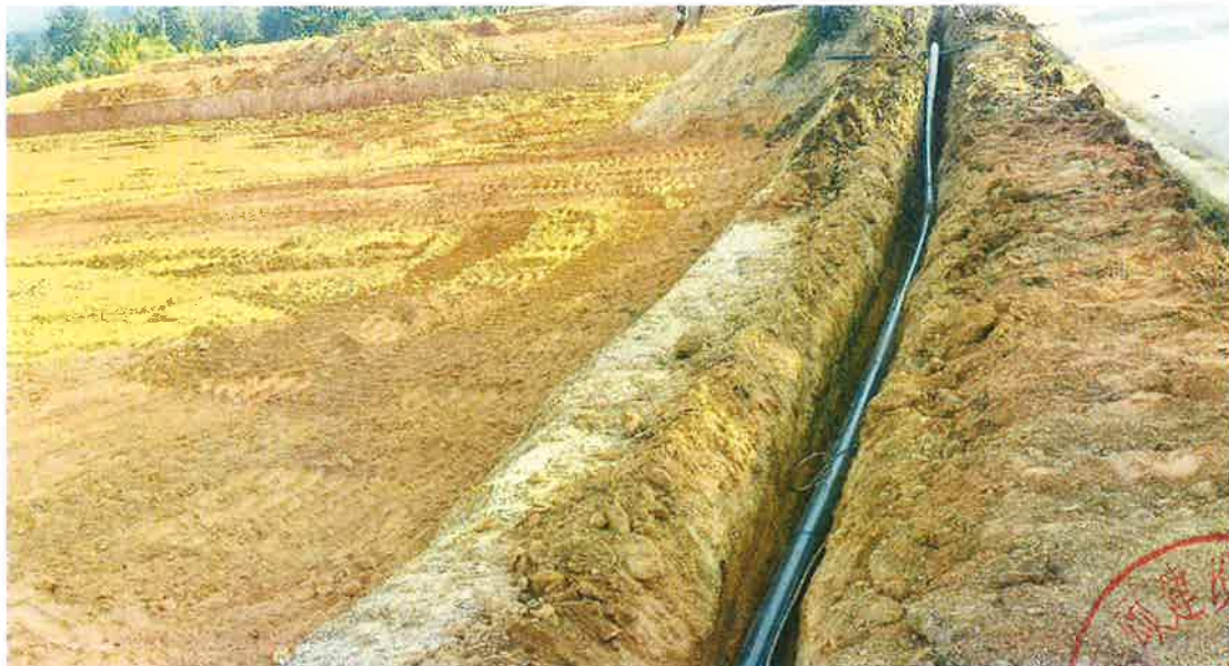
灌溉管道施工中（管道安装）