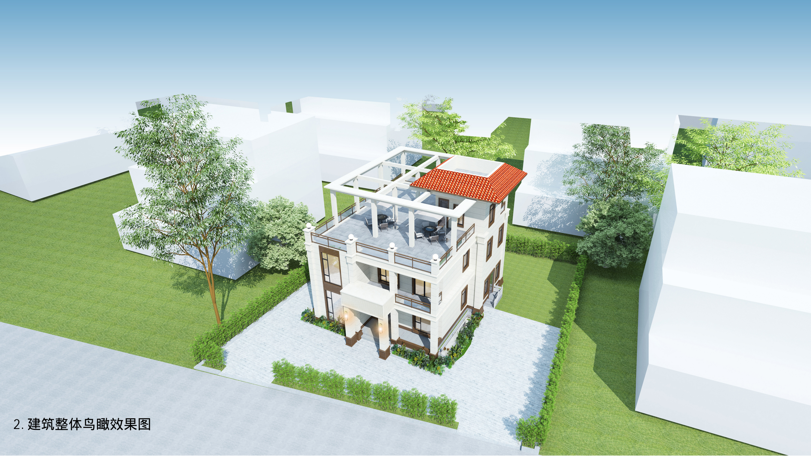
2. 建筑整体鸟瞰效果图